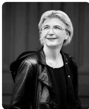
Antje Weithaas: Violine: