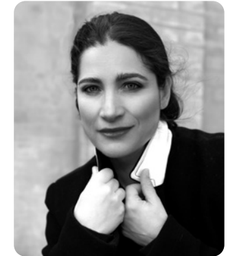
Nora Sourouzian: Mezzosopran: