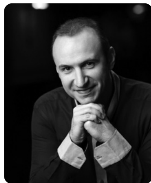
Simon Trpčeski: Klavier: