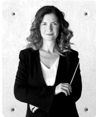
Zoi Tsokanou: Dirigentin: